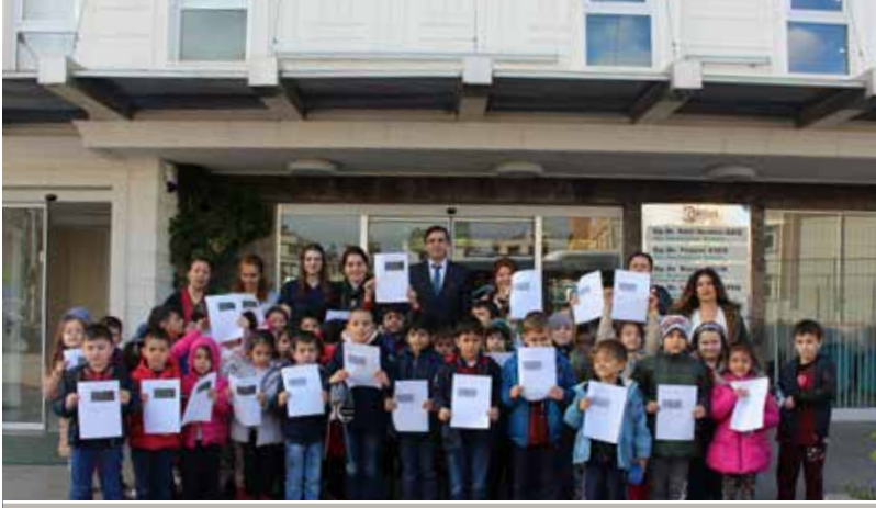
“Geleceğe Bakan Gözüm” projesi kapsamında göz taraması gerçekleşen çocuklar, sonuçlarını neşeye paylaştılar.

Antalya İl Milli Eğitim Müdürlüğümüz koordinatörlüğünde, ‘Geleceğe Bakan Gözüm’ projemizle, 3900 1.Sınıf öğrencimize ‘Görme Bozukluğu Erken Teşhis Muayenesi’ Orbit Tıp Merkezi uzman ekibi tarafından yapılmış ve öğrenciye özel düzenlenen göz sertifikalarıyla aileler bilgilendirilmiştir. Yapılan çalışmalarda, yüksek oranda görme bozuklukları tespit edilmiş ve ihtiyaç sahibi öğrencilere ulaşıp tedavileri ve gözlük ihtiyaçları karşılanmıştır.