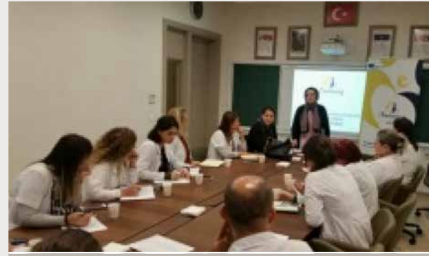
Yeditepe Koleji Konyaaltı Kampüsü