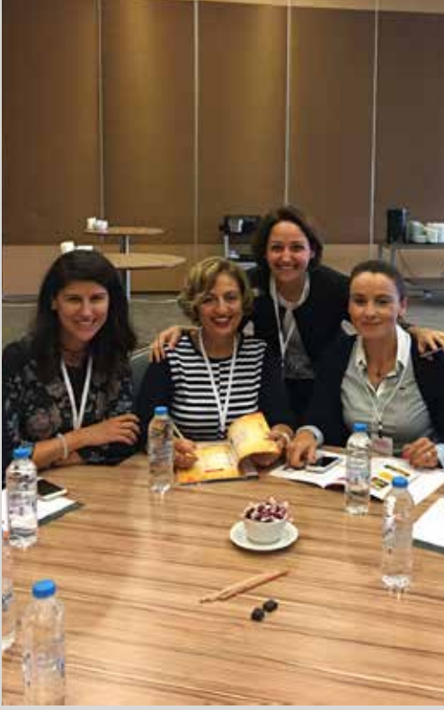
Eğiticinin Eğitimi Programı'nda, il koordinatörleri ve şube müdürleri, beslenme ve eğitim materyallerinin kullanımı konusunda detaylı bir eğitim gördü.