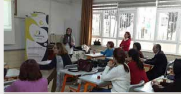
Ertuğrul Gazi İlkokulu

Bakanlığımız Yenilik ve Eğitim Teknolojileri Genel Müdürlüğü bünyesinde kurulan, Ulusal Destek Servisi (UDS) tarafından yürütülen, eTwinning çalışmaları kapsamında, 18/10/2016 tarih ve 11550840 sayılı yazılara istinaden, 22-29 Aralık 2016 tarihleri arasında, müdürlüğümüz Ar-Ge ekibince merkez ilçelerden 9 okul ziyaret edilmiş, 122 öğretmen ve idarecimize e-Twinning Portalı tanıtımı ve kaliteli proje hazırlama teknikleri hakkında bilgilendirme toplantıları düzenlenmiştir.